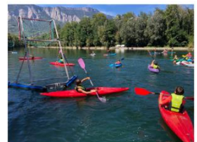
Exemples d'activités - sorties possibles